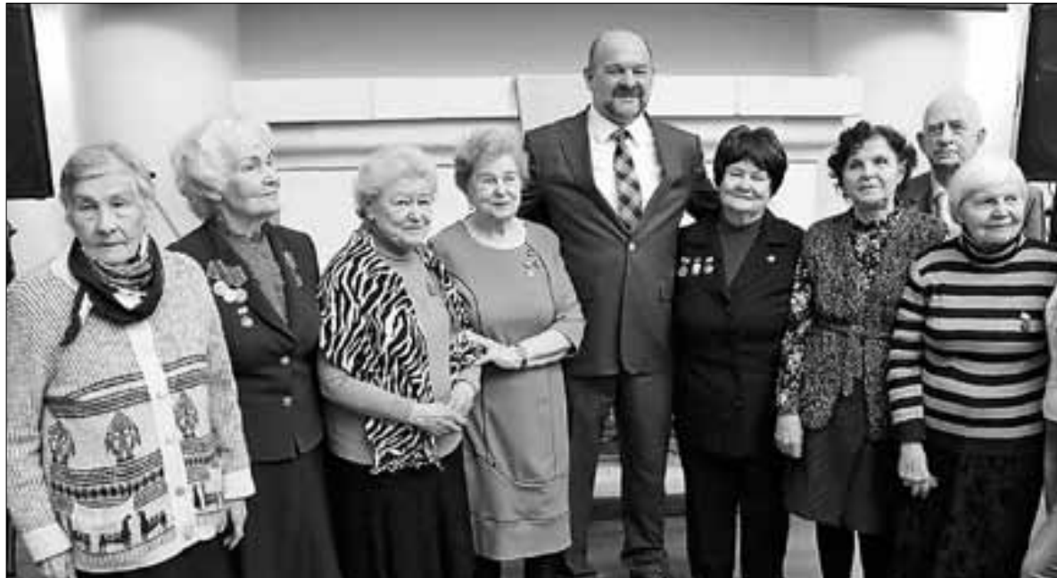
■ Игорь Орлов встретился с ветеранами на мероприятии в Гостиных дворах.

Как отметил Игорь Орлов, для Архангельской области юбилей прорыва блокады имеет особое значение – многие жители Поморья воевали на Ленинградском и Волховском фронтах. В те тяжелые времена северяне также страдали от голода. Норма выдачи хлеба в отдельные дни не превышала минимальную норму блокадного Ленинграда – 125 граммов.