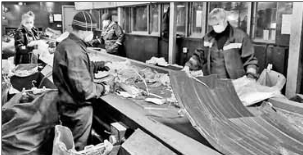
■ Сортировочная линия комбината.