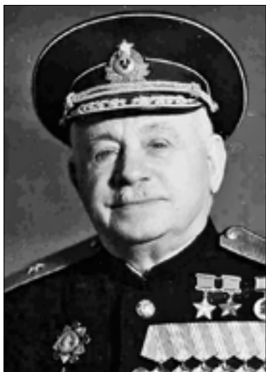
■ Иван Папанин

За два года до начала войны, в 1939-м, Иван Дмитриевич возглавил управление Главсевморпути при Совнарком-Совмине СССР. Располагалось управление в Архангельске, в здании нынешнего правительства Архангельской области. Сегодня на здании о тех го-